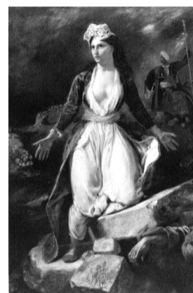
ill.3- Eugène Delacroix La Grèce sur les ruines de Missolonghi Bordeaux, Musée des Beaux-Arts Droits réservés

Dans sa quête de nouvelles sources d'inspiration, Delacroix avait trouvé en Orient les sujets aptes à porter le sentiment d'une génération d'artistes en révolte contre les règles antérieures. Avec Les massacres de Scio (1824) et La Grèce sur les ruines de Missolonghi , 1826 (ill.3), le combat d'indépendance des Hellènes devient une cause défendue par l'avant-garde romantique. Elle incarne le combat des valeurs civilisatrices de la Grèce antique face à la sauvagerie ottomane. Le portrait de Jeune fille, costume d'Athènes* illustre cette vogue pour les sujets grecs : s'il est probable qu'il s'agisse d'un portrait de fantaisie, c'est cependant une image pittoresque et intimiste nourrie d'un Orient familier qu'en donne Duvidal de Monferrier (1797-1869).