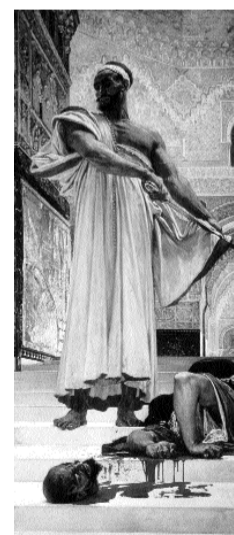
ill.4- Henri Regnault Exécution sans jugement sous les rois Maures, 1870 Paris, Musée d'Orsay

Au contact de l'Orient, les artistes découvrent aussi une nouvelle dimension du paysage : les horizons infinis et leur luminosité renouvellent grandement le genre encore marqué par l'héritage classique. Fromentin (1820-1876) part en Afrique à plusieurs reprises entre 1846 et 48. Fasciné par la vie nomade il s'aventure dans le Sud profond, vierge de toute présence française. Avec une distance pudique, il montre la smalah de Si-Hamed-Bel-Hadj* : plutôt que de donner une vision descriptive du campement bédouin, il transcrit l'atmosphère saturée de chaleur et, d'une touche mouchetée, dissout les formes dans l'ocre du sol et l'étendue du ciel. Paysagiste de formation classique, Bellel (1816-1898) se rend lui aussi au Maghreb (1856) où il découvre l'immensité saharienne. De même que son prédécesseur, il déploie dans La Nezla d'Ouargla* un panorama désertique plein d'ampleur où une caravane chamarrée invite au voyage.