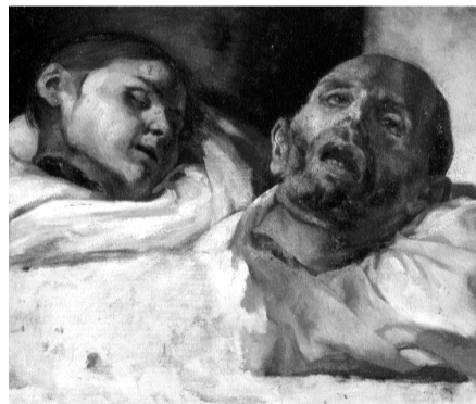
ill.1- Théodore Géricault Etude de têtes coupées Stockholm, Nationalmuseum Droits réservés

Considéré très tôt comme le chef de file du mouvement romantique, Delacroix est sans doute l'un des artistes les plus emblématiques du XIX e siècle. L'Orient occupa une place importante de son art mais il sut être aussi bien peintre d'histoire qu'ordonnateur de grands décors. L'orientalisme constitue pour lui comme pour ses contemporains, plutôt qu'un genre à part entière, un moment privilégié de sa carrière auquel il puise une nouvelle inspiration. Formé chez Pierre Narcisse Guérin (1774-1833), élève de David (1748-1825) défenseur de la tradition classique, il noue dans cet atelier ses premières amitiés : Théodore Géricault (1791-1824), de 7 ans son aîné, le marque profondément : Son Etude de pieds et de main* dont Delacroix écrit « Ce fragment de Géricault est vraiment sublime. C'est le meilleur argument en faveur du beau comme il faut l'entendre », témoigne du vaste travail préparatoire de l'artiste pour Le radeau de la Méduse . Dans cette morbide nature morte – elle fut composée à partir de véritables fragments humains comme ses autres études pour le tableau (ill.1) – il dépeint avec des tonalités profondes une nouvelle réalité en rupture avec les canons du beau idéal. Par la violence et la suavité de sa représentation, il ouvre la voie à une modernité annonciatrice du romantisme de Delacroix.